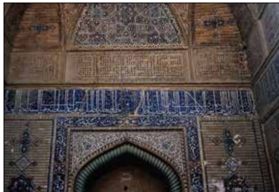
شکل ۱. کتیبه کمربندی سردر مسجد علی حاوی نام معمار (Babaie, 2017).

در نمونه‌های بررسی شده، اسامی معماران در بخش‌های مختلفی از بناها قرار گرفته است. ورودی بنا بیش از سایر بخش‌ها محل درج این اسامی بوده است، به طوری که در سیزده نمونه یعنی بیش از نیمی از نمونه‌ها شامل پنج مسجد، پنج آرامگاه، یک مدرسه، یک رباط و یک حمام نام معماران در یکی از مهم‌ترین بخش‌های بنا یعنی ورودی اصلی قرار گرفته‌اند. همچنین از میان آن‌ها در ده نمونه یعنی نزدیک به نیمی از نمونه‌ها (مساجد علی، قطیبه، جامع عباسی، بقعه هارون ولایت، امامزاده ابراهیم، امامزاده محروق، امامزاده محمد نفرش، حرم امام رضا (ع)، حمام گنجعلی خان و رباط شیخعلی خان) نام معمار در کتیبه اصلی سردر و یا به صورت مجزا در زیر، بالا یا انتهای آن آمده است (شکل ۱). حضور این تعداد کتیبه حاوی نام معماران در مکان مهمی مانند سردر ورودی در قیاس با پیش از صفوی و نمونه کتیبه قوام‌الدین در مسجد گوهرشاد بیانگر شکل‌گیری تغییری در جایگاه معماران است. قدیمی‌ترین نمونه در این دسته کتیبه هارون ولایت است و نسبت به کتیبه قوام‌الدین، نام معمار از کنار و پایین ایوان به سردر ورودی بنا منتقل شده است. در سایر نمونه‌ها نیز عموماً اسامی معماران در بخش‌های مهم بنا نظیر محراب، گنبد و هشتی قرار دارند.