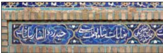
شکل ۲. بخشی از کتیبهٔ دوبیتی دربارهٔ معمار و حاوی نام او به همراه درج مجدد نام او میان دو بیت در امامزاده محروق (خسروی بیژانم، ۱۳۹۵).