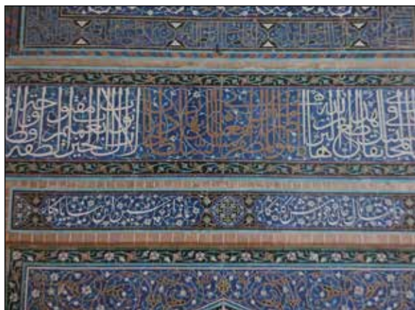
شکل ۴. بیت شعر حاوی نام معمار و حامی حکومتی ذیل کتیبه حاوی نام شاه صفوی در بقعه هارون ولایت (Babaie, 2017).