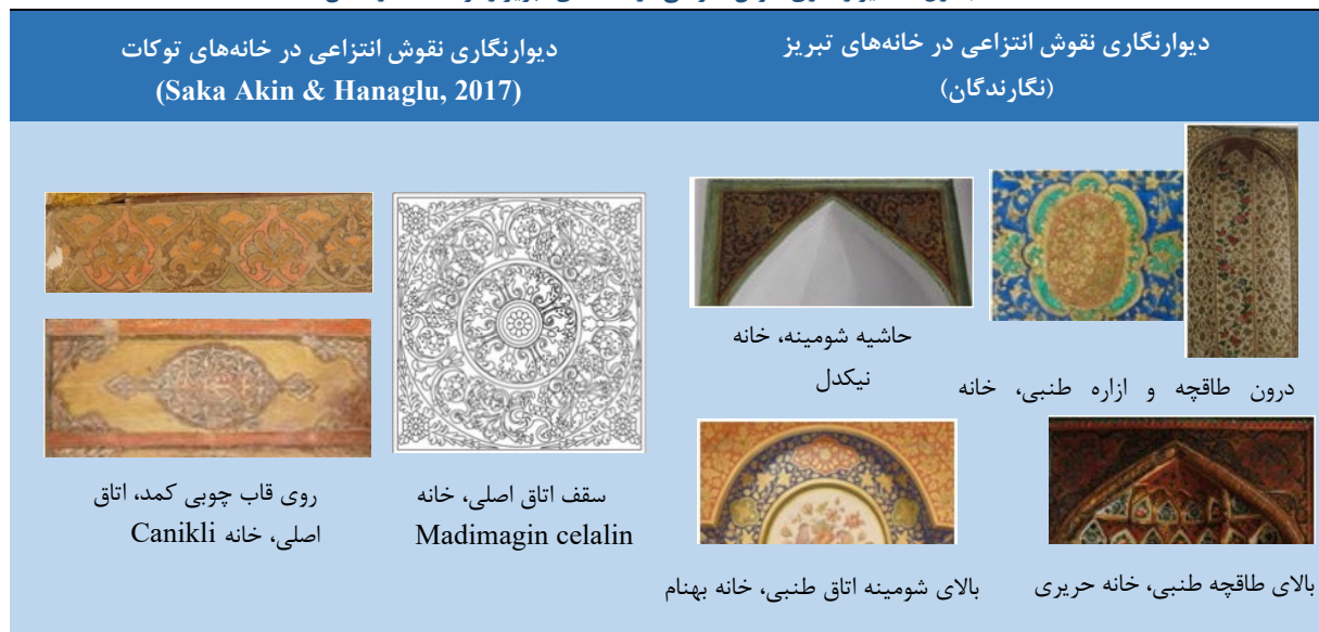
جدول ۱۱. دیوارنگاری نقوش انتزاعی در خانه‌های تبریز و توکات (نگارندگان)

در خانه‌های توکات نیز مانند خانه‌های تبریز نقوش انتزاعی با حرکت‌های دایره‌وار و پویای اسلیمی و گل‌های ختایی در سقف و روی قاب چوبی کمد در پس زمینه‌های نارنجی و زرد به تصویر کشیده شده‌اند.