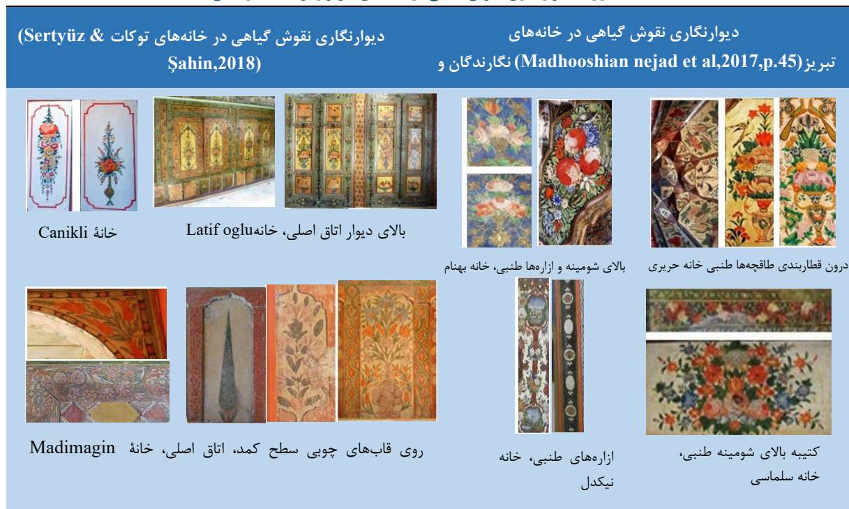
جدول ۹. دیوارنگاری، نقوش گیاهی در خانه‌های تبریز و توکات (نگارندگان)

در خانه‌های توکات نیز نقوش گیاهی مانند نقوش گیاهی خانه‌های تبریز متأثر از سبک‌های اروپایی می‌باشد. از خصوصیات این نقوش، ترسیم گلدان‌های پر از گل از جمله گل لاله که از معروف‌ترین نقوش هنر عثمانی است.