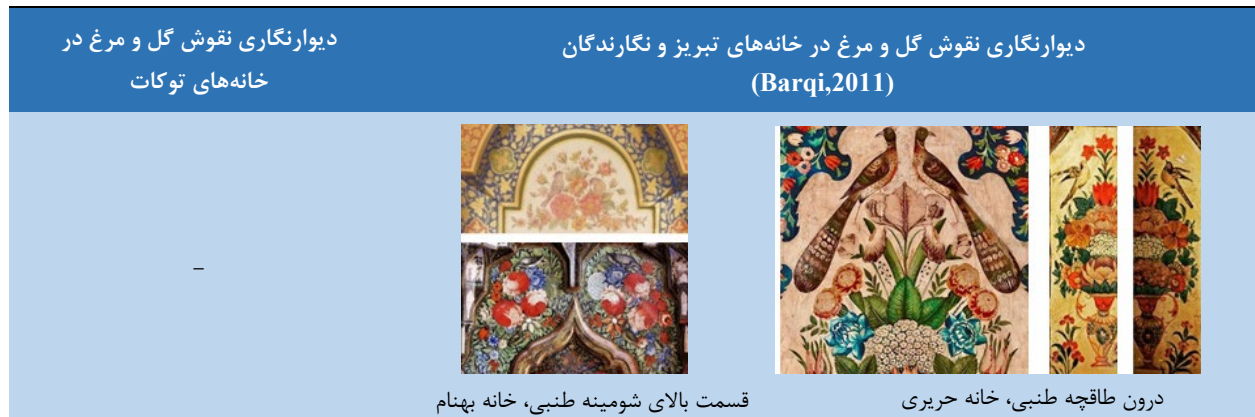
جدول ۱۰. دیوارنگاری نقوش گل و مرغ در خانه‌های تبریز و توکات

گل و مرغ نام یکی از سبک‌های نگارگری ایرانی است. این نقوش، با الهام از طبیعت همچون؛ گل‌ها، درختان و انواع پرندگان مانند بلبل و طاووس به تصویر کشیده شده‌اند. در تمام تصاویر پرندگان بصورت تک مرغ بکار نرفته بلکه در برخی آثار مرغ و یا طاووس در کنار هم و یا در روبروی هم بکار رفته‌اند