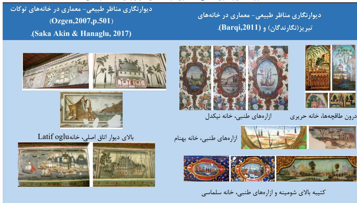
جدول ۷. دیوارنگاری طبیعی- معماری در خانه‌های تبریز و توکات (نگارندگان)

تصویرسازی بناها، مساجد، مناره‌ها، نمای شهری و تجهیزات مدرن مانند قایق‌های بادبانی به تاثیر از پرسپکتیو و طبیعت‌نگاری سبک اروپایی در قطع‌های بزرگتر در بالای دیوار ترسیم شده‌اند. عدم تبحر هنرمند در استفاده از تکنیک‌های اروپایی مشهود است.