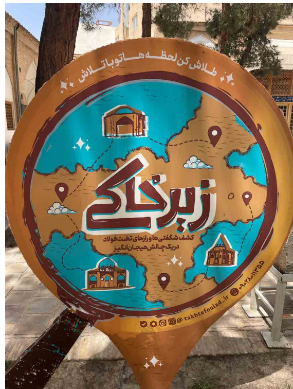
تصویر ۱: تابلوهای «زیرخاک» برای جست‌وجوی گنج در تکیه میرفندرسکی قبرستان تخت فولاد اصفهان. Fig. 1: “Treasure” signs for treasure hunting in the Takht-e Foulad Cemetery of Isfahan.

همین پدیده در دیگر کشورها نیز رایج است. برای نمونه، در اوایل سده بیستم، برخی روزنامه‌های زرد انگلستان (هم‌چون Tit-bits) گنج‌های کوچکی (برای نمونه پانصد پوند) را در جایی پنهان می‌کردند و سپس در داستان‌های چند قسمتی در روزنامه، نشانه‌هایی از آن گنج را برملا می‌ساختند. خوانندگان علاقه‌مند هم با خرید روزنامه و یافتن آن سرخ‌ها، به سراغ مبلغ پنهان شده می‌رفتند و خوش شانس‌ترین‌شان آن را می‌یافت. برخی از دیگر روزنامه‌ها، ژتون‌ها یا اشیاء خاص دیگری را در نقاط مختلف لندن مخفی می‌کردند و به ازای یافتن هر کدام از آن‌ها، پنجاه پوند به یابنده جایزه می‌دادند. همین مشوق باعث شده بود بسیاری از انگلیسی‌ها جلوی دفتر این روزنامه‌ها منتظر انتشار نسخه جدید باشند تا شاید زودتر از دیگران به این ژتون‌ها دست پیدا کنند (دیلینگر، ۲۰۱۲: ۲۰۰). تجربه چیلک از انجام کار مردم‌نگاری در کردستان ترکیه درباره گنج‌یابی جالب توجه است: