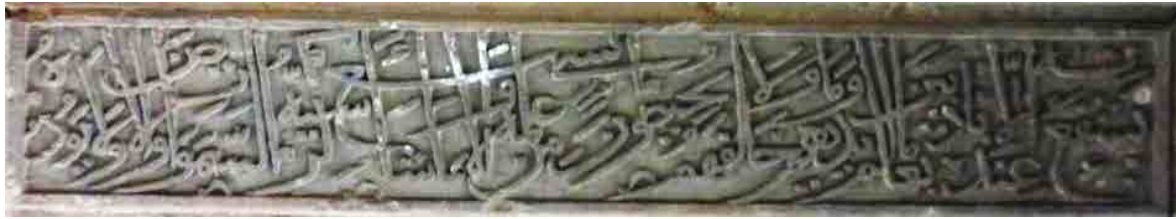
تصویر ۱: کتیبه آیه الکرسی صندوق قبر امامزاده سید محمد زرین نوا قائمشهر (نگارندگان، ۱۳۹۹).