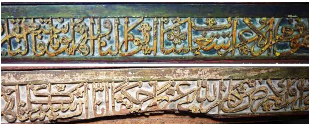
تصویر ۵: کتیبه صندوق قبر امامزاده عبدالصالح روستای مرز رود ساری (نگارندگان، ۱۳۹۹). Fig. 5: Inscription on the Tomb Chest of Imamzadeh Abd al-Salih, Marzrud Village, Sari (Authors, 2020).

دعای نادعلی‌اند. سوره فتح با محوریت صلح حدیبیه و وعده فتح الهی برای مؤمنان در مقابل مشرکان، بار سیاسی آشکاری دارد و قرار گرفتن آن در رتبه چهارم فراوانی، بیانگر برجستگی رویکردهای سیاسی-مذهبی در جامعه است. در سوره صف نیز تأکید بر مضامین جهاد تحت اطاعت از رسول و مقاومت در این مسیر است؛ و آیه ۱۳ سوره با وعده نصرت الهی، بعدی سیاسی و جهادی دارد ۱۳ (تصویر ۵). هم‌چنین دعای نادعلی با تمرکز بر صفات جهادی و حماسی امام علی علیه السلام نظیر قهار، قاهرالعدو، منتقم و جبار، مؤید نوعی نگرش سیاسی و مذهبی در قالب توسل است. این موارد نشان‌دهنده هم‌زیستی باور دینی با دغدغه‌های سیاسی در متون کتیبه‌ای آن دوره‌اند.