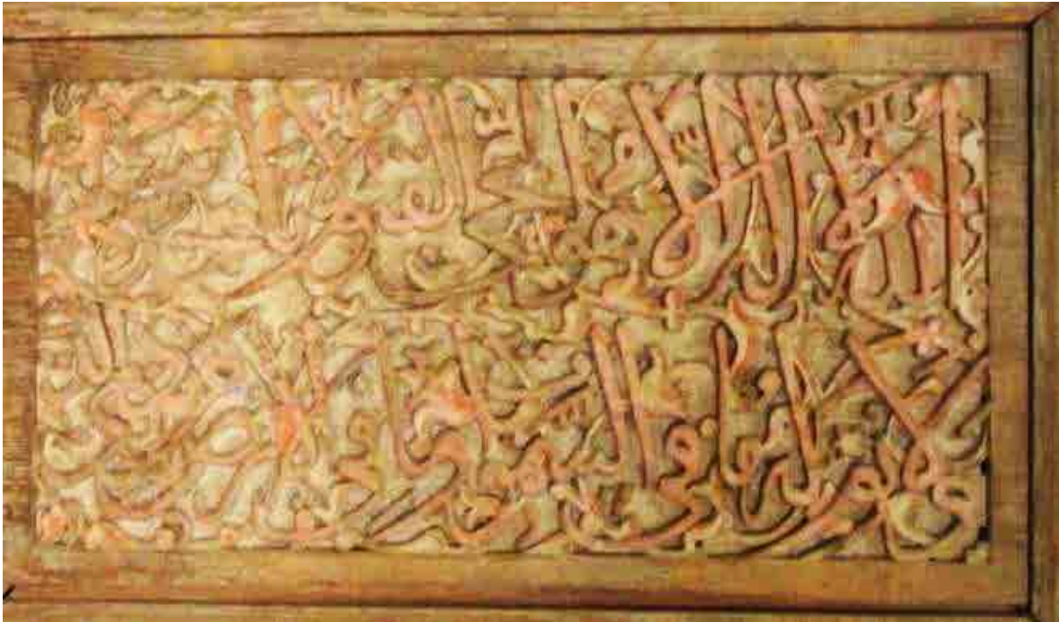
تصویر ۶: کتیبه آیه‌الکرسی در ورودی بقعه امامزاده مفید نکاء (نگارندگان، ۱۳۹۹).

علاوه بر بهره‌مندی از حرز، توسل و دعا نیز وجه دیگری است که در برخی مضامین جلوه‌گر شده است. مضمونی چون دعای نادعلی به وضوح توسل به فضائل امیرالمؤمنین علیه السلام است. وجود این موارد نشان از انس جامعه با گفتار دعایی و نیازشان به التجاء و پناه بردن به مأمی مطمئن و بهره‌مندی از حرز جهت حفظ از شرور است. اگرچه نیازهای مذکور فطری همه انسان‌هاست اما شاید تجربیات عموم جامعه در لمس حوادث و درک فرازونشیب‌ها و نفس کشیدن در فضای پر مخاطره آن روزگار دلیلی باشد بر درک عمیق‌تر ضرورت و نیاز به حرز و توسل.