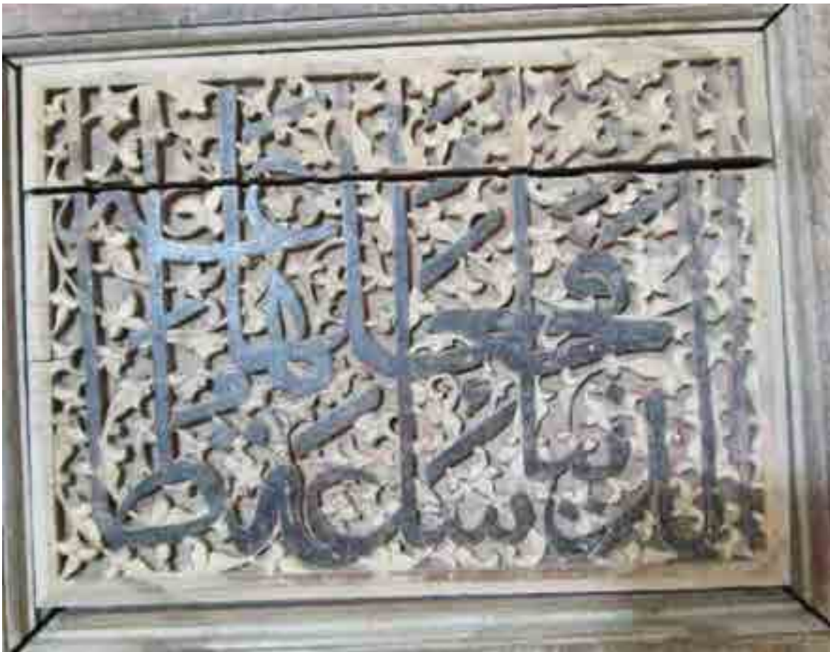
تصویر ۳: «حدیث الدنيا ساعة و جعلها طاعة» بر روی در ورودی امامزاده احمد بهشهر (نگارندگان، ۱۳۹۹).