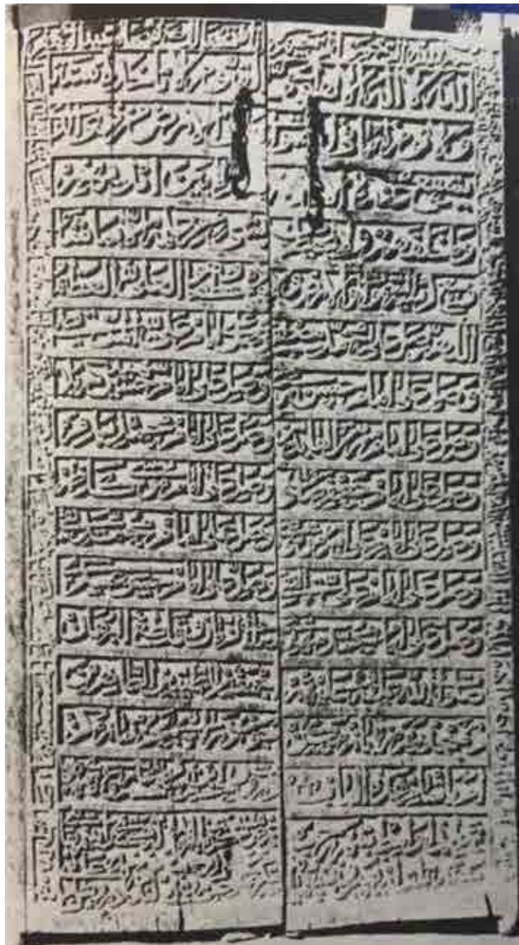
تصویر ۲: صلوات بر ۱۴ معصوم بر روی در امامزاده محمد نور (ستوده، ۱۳۷۵: ۹۳۷).

Fig. 2: Inscription of the Salutations upon the Fourteen Infallibles on the Door of Imamzada Muhammad, Nur (Sotoudeh, 1995: 937).