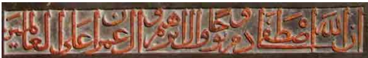
تصویر ۴: کتیبه صندوق قبر امامزاده یحیی ساری (نگارندگان، ۱۳۹۹). Fig. 4: Inscription on the Tomb Chest of Imamzadeh Yahya, Sari (Authors, 2020).

دعای نادعلی‌اند. سوره فتح با محوریت صلح حدیبیه و وعده فتح الهی برای مؤمنان در مقابل مشرکان، بار سیاسی آشکاری دارد و قرار گرفتن آن در رتبه چهارم فراوانی، بیانگر برجستگی رویکردهای سیاسی-مذهبی در جامعه است. در سوره صف نیز تأکید بر مضامین جهاد تحت اطاعت از رسول و مقاومت در این مسیر است؛ و آیه ۱۳ سوره با وعده نصرت الهی، بعدی سیاسی و جهادی دارد ۱۳ (تصویر ۵). هم‌چنین دعای نادعلی با تمرکز بر صفات جهادی و حماسی امام علی علیه السلام نظیر قهار، قاهرالعدو، منتقم و جبار، مؤید نوعی نگرش سیاسی و مذهبی در قالب توسل است. این موارد نشان‌دهنده هم‌زیستی باور دینی با دغدغه‌های سیاسی در متون کتیبه‌ای آن دوره‌اند.